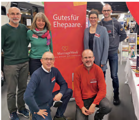
Team der MarriageWeek Nürnberg und Stein auf der Consumenta 2021 ▶