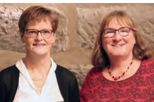
Leitung MarriageWeek Erlangen ▲